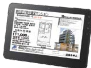
物件表示→店員を呼ぶ