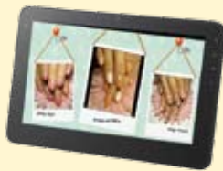
サロン施術カタログ