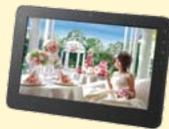
ブライダルプラン