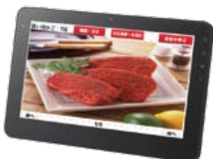
メニュー表示→注文